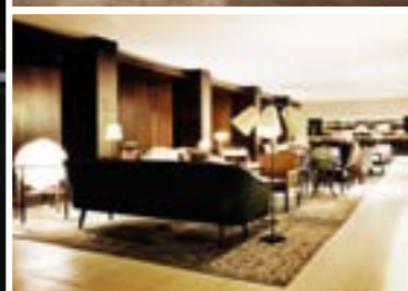
Lässig und elegant: das Hotel Square Nine. /// Laid-back and elegant: the Hotel Square Nine.